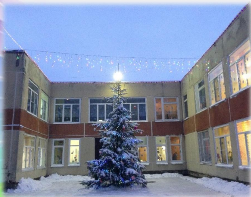
Муниципальный конкурс «Новогодние огни»