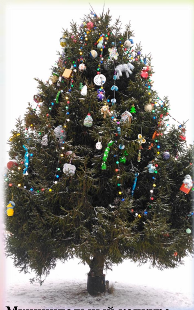
Муниципальный конкурс «Игрушки на елку»